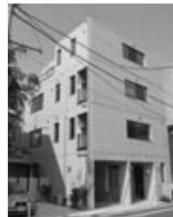
敷地75坪のミニマンション

プロジェクトが軌道に乗るまでは会社全体で顧客一人一人と向き合うという。デザインや建築法規、コストマネジメントなど家づくりに欠かせない各分野に精通する建築士が活発な意見交換を行い、顧